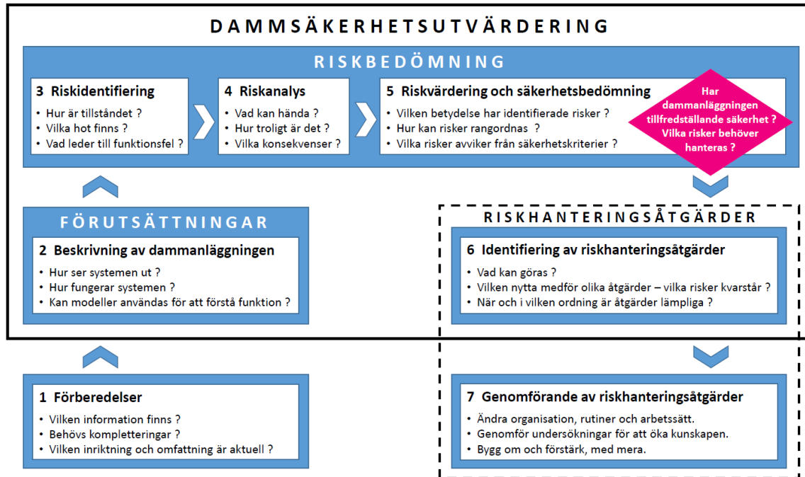
Figur 2. Dammsäkerhetsutvärdering – steg och frågeställningar.